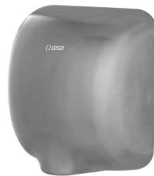
REF: CS-601-S/X Acabado ACERO INOX SATINADO