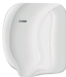
REF: CS-601-X Acabado METALLACADO BLANCO