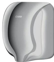
REF: CS-601-I/X Acabado ACERO INOX BRILLO