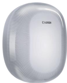
REF: CP-5010-B Acabado BLANCO