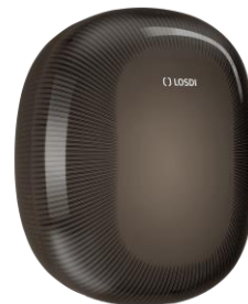
REF: CP-5010-BL Acabado NEGRO