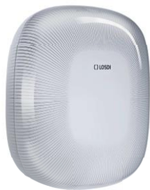
REF: CP-5009-B Acabado BLANCO