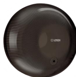
REF: CP-4000-BL Acabado NEGRO