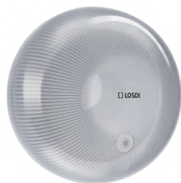
REF: CP-4000-B Acabado BLANCO