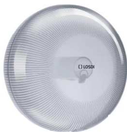
REF: CP-5007-B Acabado BLANCO