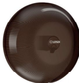
REF: CP-5007-BL Acabado NEGRO