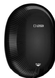
REF: CJ-5003-BL Acabado NEGRO