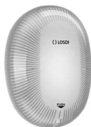
REF: CJ-5003-B Acabado BLANCO