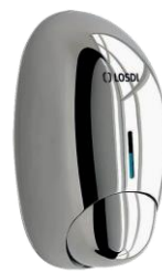
REF: CJ-1001-I Acabado BRILLO