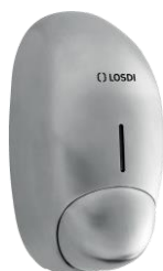
REF: CJ-1001-S Acabado SATINADO