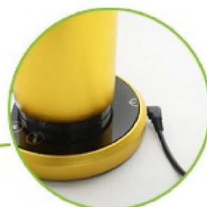
Conexión de enchufe de cable y adaptador DC 12V / 1A: seguro y conveniente para todo el mundo.