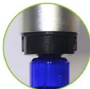
Fácil instalación de botella de relleno y esencia.