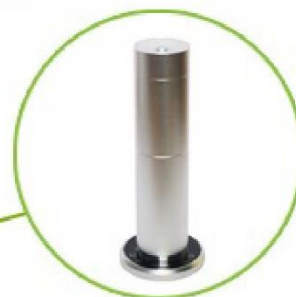
Material: aluminio, diseño elegante.