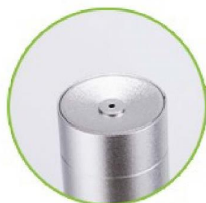
Boquilla de difusor concisa.