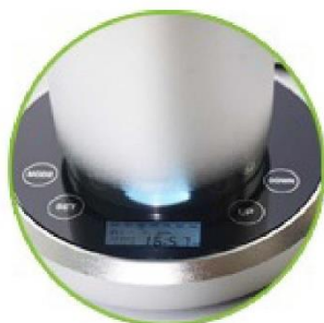
Control inteligente: Ajuste de concentración y tiempo, función de memoria para un uso más conveniente.